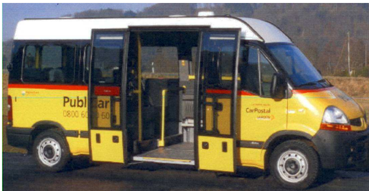
Pino 300 Pino 200 Pino 100